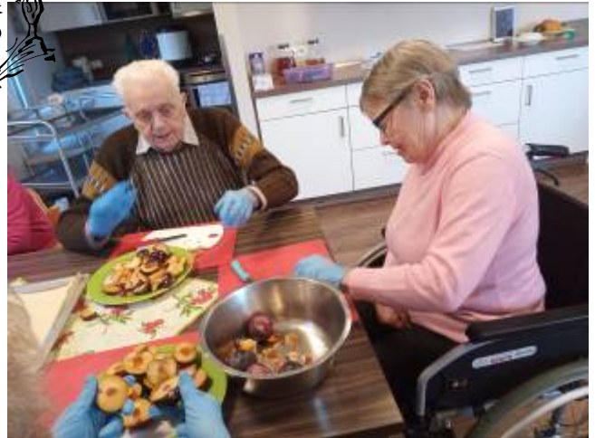
Unsere Koch- und Backgruppe...