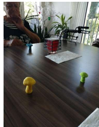
Die Finger/Hände und die Kreativität wurden beim Formen mit Knete gefordert.