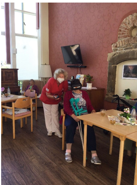
Reisen in virtuelle Welten...