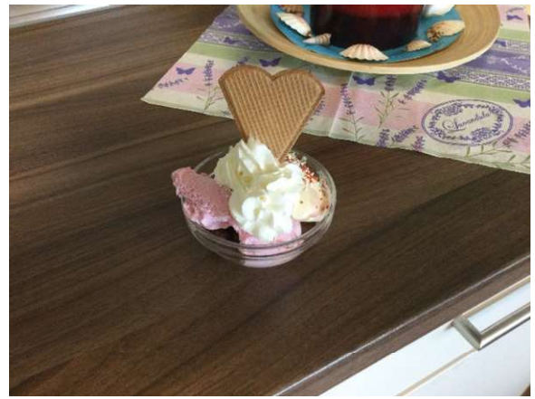
Eisbecher von unseren Bewohnern selbst gemacht. Schemckt lecker...