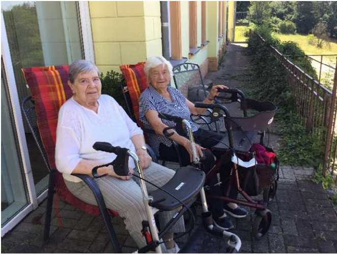
Das schöne Wetter genießen...