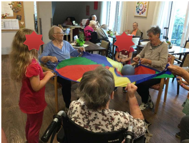
Sportprojekt mit den Kindern des Kinderhaus Neustädtel...