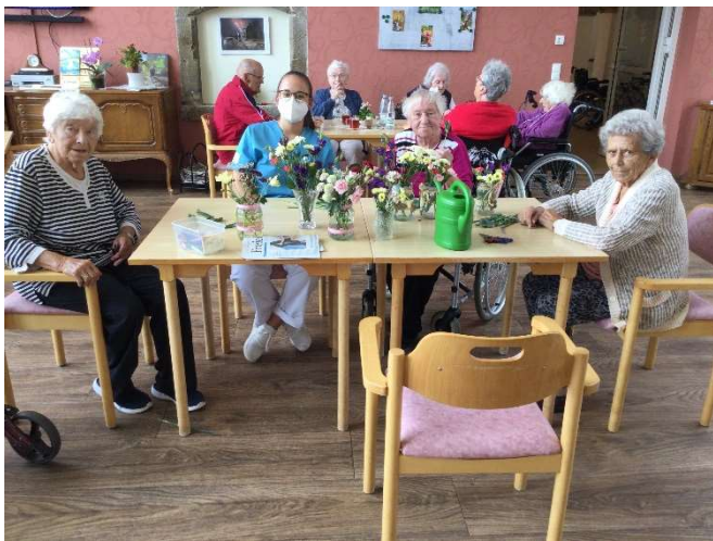
Gemeinsam binden wir Blumen für unseren Tischschmuck...