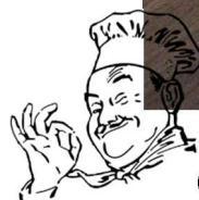
Geburtstags – Wunschessen Rouladen mit Rotkohl und Klößen Alles selbstgemacht und lecker...