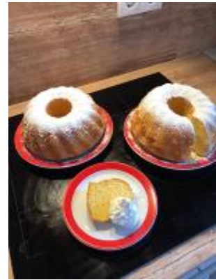
Koch- und Backgruppe, es duftet herrlich nach köstlichem Gugelhupf...