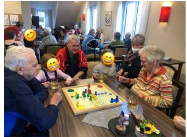
Spielvormittag mit den Kindern des Kinderhaus Neustädtel...