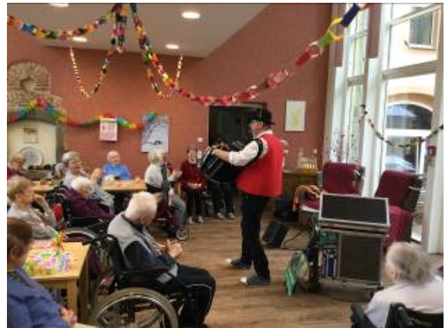
Helau und Alaaf, bei uns waren die Narren los...