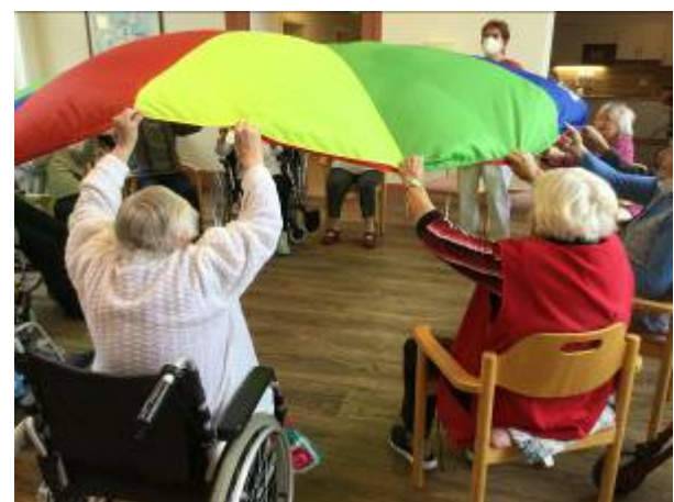
Wir halten uns fit, egal ob Kegeln oder Ballspiele, wir haben Spaß und bleiben in Bewegung...