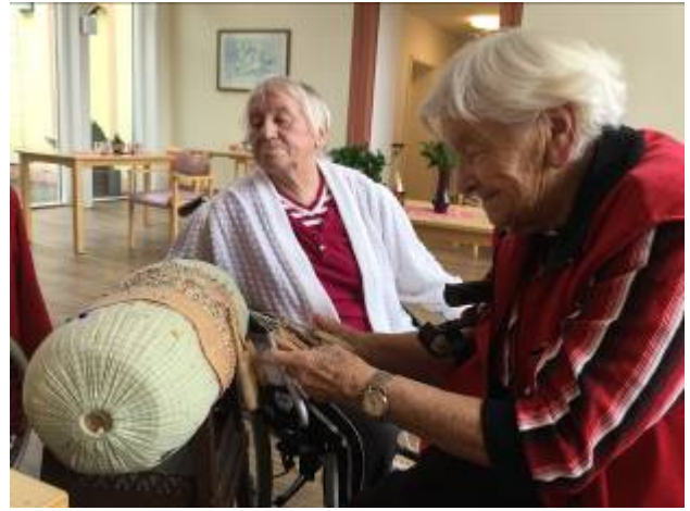
Unser neues Betreuungsangebot, klöppeln. Eine wahre Freude...