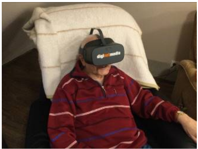
Bei einer Maniküre ließen sich unsere Bewohner verwöhnen, während andere mit unserer VR-Brille auf ferne Reisen gingen...