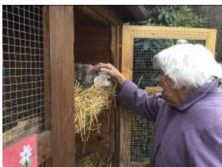
„Besuch unserer tierischen Mitbewohner, immer wieder beliebt...