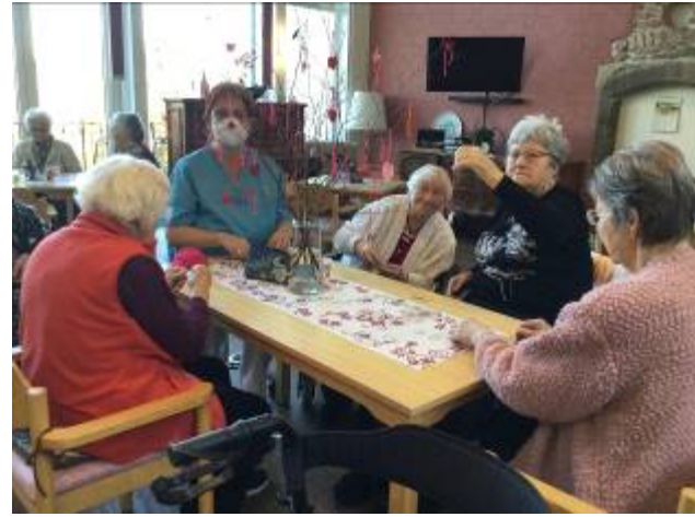
Wir waren kreativ und haben unser Dekoration für den kommenden Frühling gebastelt...