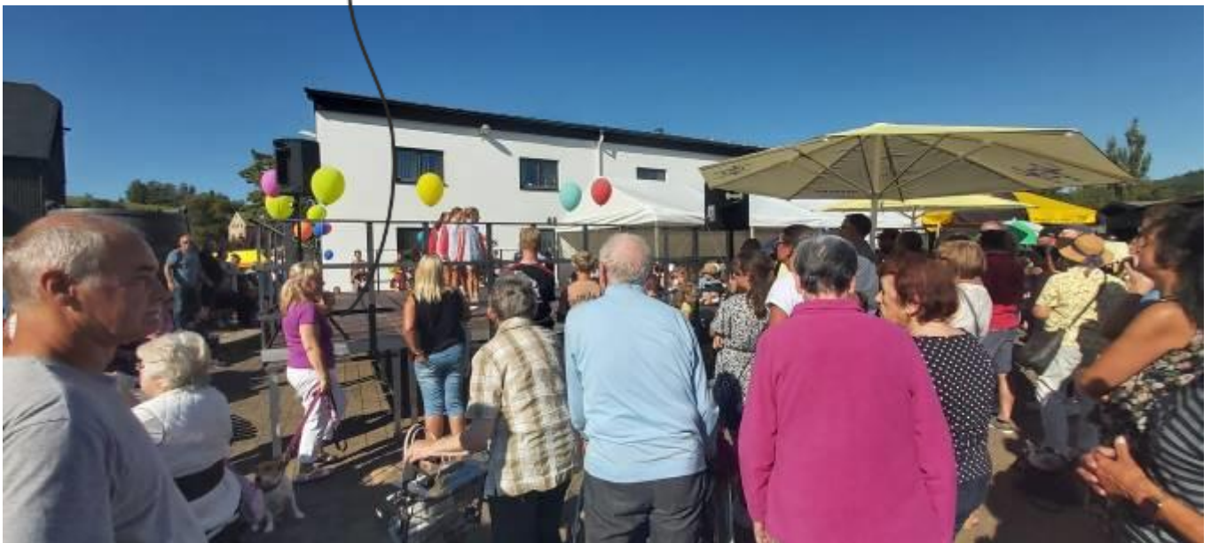
Ausflug zum 32. Sommerfest, Menschen mit und ohne Behinderung feiern gemeinsam auf dem Gelände der Schneeberger Bergsicherung... Das ließen wir uns natürlich nicht nehmen und feierten kräftig mit...