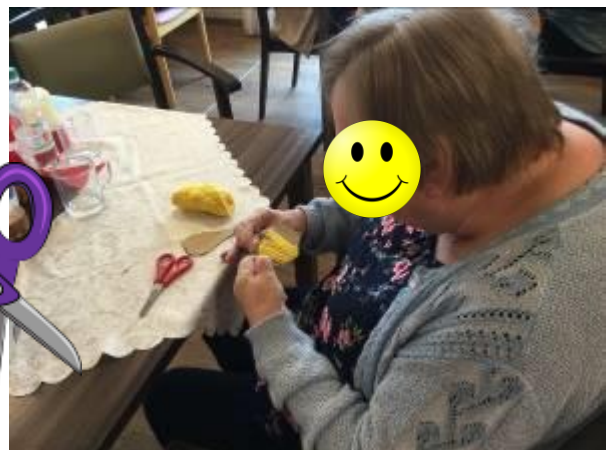
Wir waren kreativ...