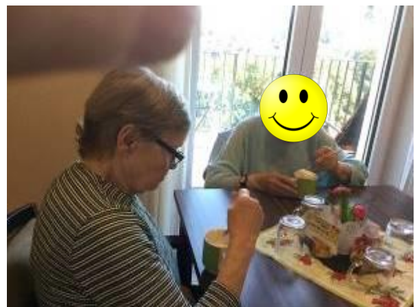
Aber bitte mit Sahne...