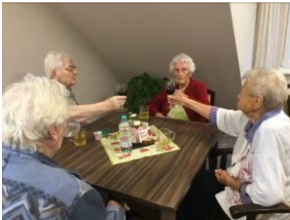
Manchmal gab es Grund zum anstoßen...