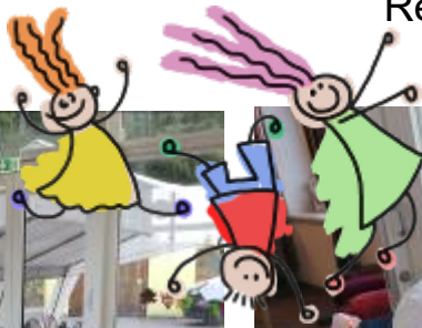
Reisen in ferne Länder...