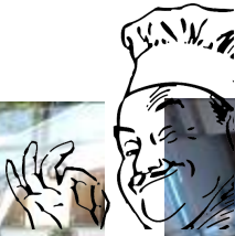
Unsere Koch- und Backgruppe...