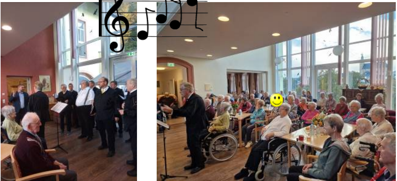
Konzert des Bergchor's Schneeberg